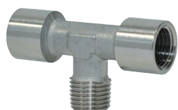
Racores estándar en acero inoxidable AISI316, roscas de 1/8" a 1/2"