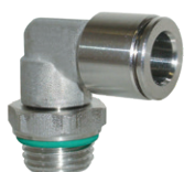
Racores automáticos en acero inoxidable AISI316, tubo de Ø 4 a 12 mm, rosca de M5 a 1/2"