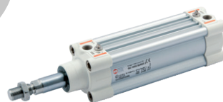
Cilindros serie HCR, High Corrosion Resistance (alta resistencia a la corrosión), norma ISO 15552, diámetros de 32 a 125 mm