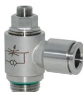
Reguladores de caudal en acero inoxidable AISI 316, roscas de 1/8" a 1/2"