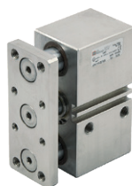
Cilindros especiales en acero inoxidable