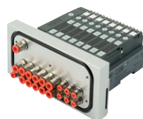
Islas de electroválvulas para área Splash, serie HDM, EB 80 de 4 a 16 electroválvulas